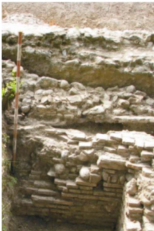
zidul primei incinte