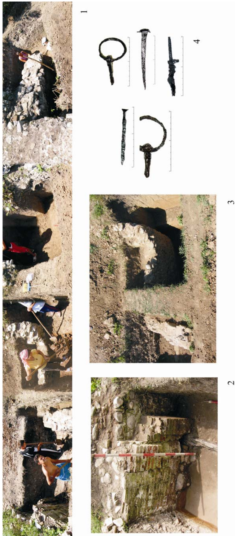
Pl. IV. 1–3. Aspecte de la cercetarea gârlăciului beciului domnescu; 4. Obiecte descoperite în zona gârlăciului.